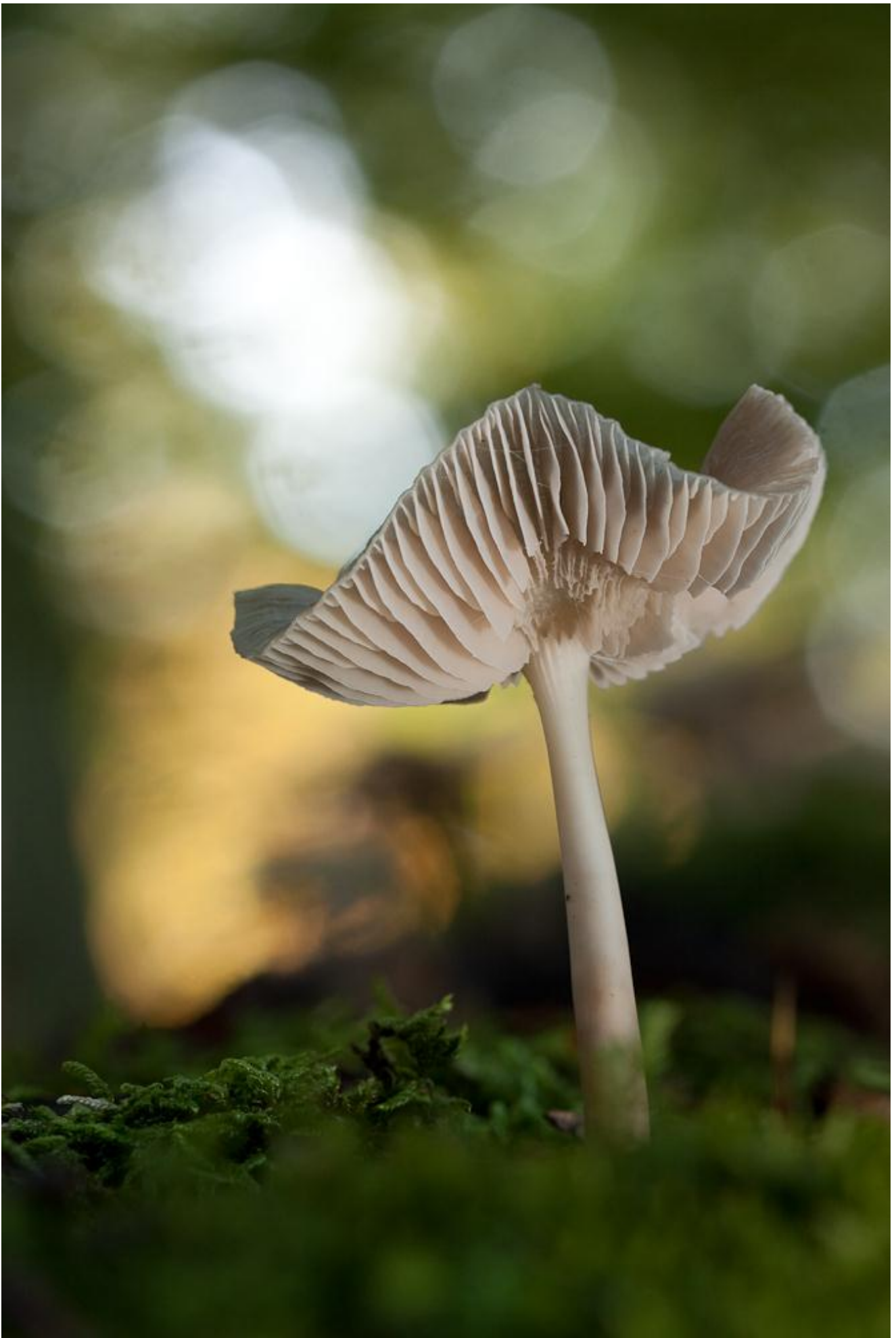
VNF-Nijmegen november/december 2011